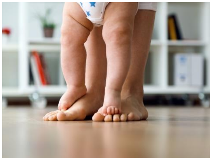
Fødderne er vores fundament igennem hele livet.

Sygdomme i fødderne kan være lidelser som diabetes, gigtlidelser, lammelser, overbelastninger med mere. Disse sygdomme kan være årsag til at der opstår skader, deformiteter og smerter i fødderne, som kræver behandling. En del sportsudøvere får også brug for hjælp til fødderne.