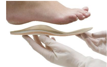
Individuelt fremstillet fodindlæg.

Hvis der ikke er behov for et individuelt fremstillet fodindlæg, men fodens stilling kan korrigeres med et standard fabrikat, har BandaGisten Forssling og Co et stort udvalg i forskellige kvalitets fodindlæg til at aflaste diverse problemstillinger.