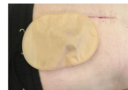
I liggende stilling "falder bulen på plads"